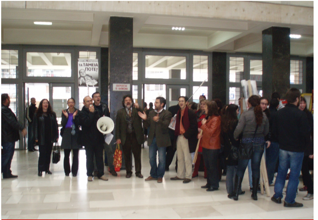
20/3/08 Αποκλεισμός Δικαστηρίων και πορεία εντός του Μεγάρου