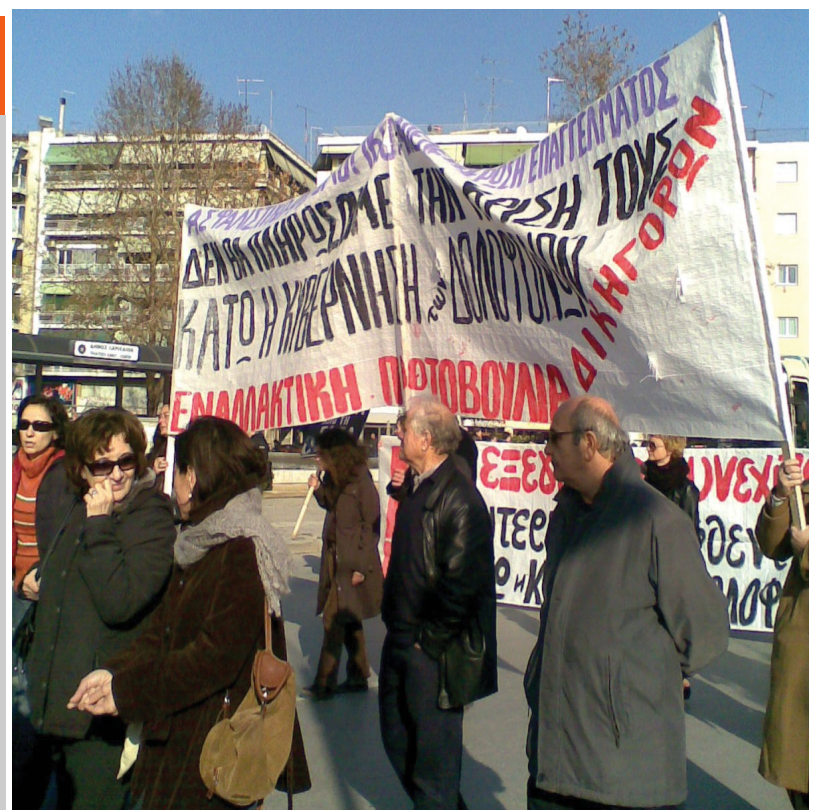
17/1/09 Συμμετοχή στην Πανελλαδική πορεία στη Λάρισα κατά της εφαρμογής του τρομονόμου σε ανήλικους διαδηλωτές του Δεκέμβρη

Όλοι εμείς, θεωρούμε πως κάθε πραγματικός λειτουργός της δικαιοσύνης έχει χρέος να αγωνίζεται αυτόνομα και συλλογικά, για την προώθηση και ικανοποίηση των δικαιωμάτων των φυλακισμένων, μέχρι που οι φυλακές φανερώσουν την βάρβαρη καταγωγή τους, μέχρι να ξεγυμνωθούν από την αλήθεια πως οι παραπάνω δεν καταστέλλουν παράνομες συμπεριφορές αλλά παράγουν κοινωνική βία και αδικία, μετατρέποντας το θεσμό της δικαιοσύνης σε φορέα εκδικητικότητας και τιμωρίας των συνανθρώπων μας, μέχρι, δηλαδή, οι φυλακές να γίνουν ένα ιστορικό παρελθόν.