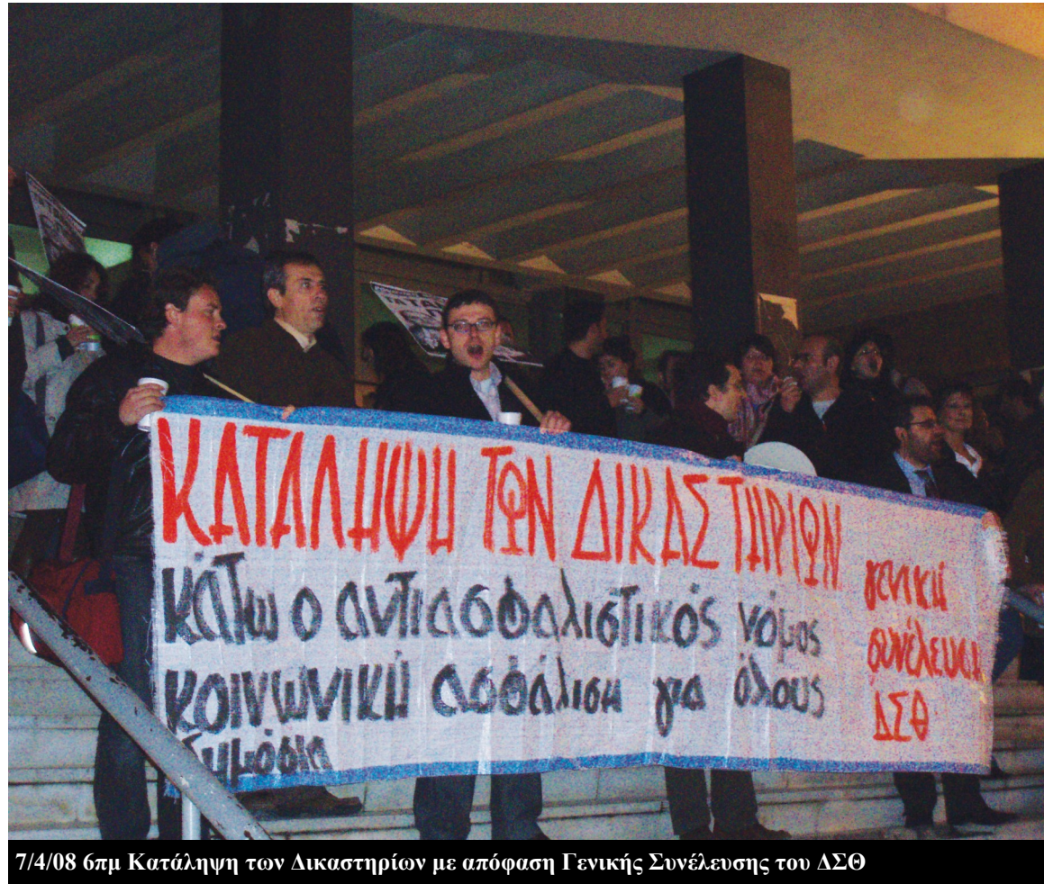
7/4/08 6πμ Κατάληψη των Δικαστηρίων με απόφαση Γενικής Συνέλευσης του ΔΣΘ